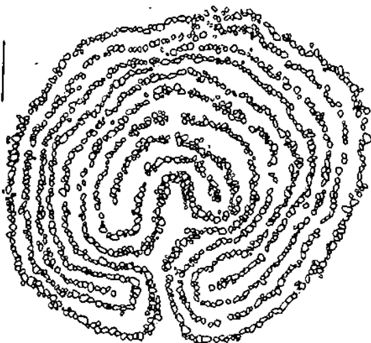
"Mariaringen" eller "Jungfruringen" på Kasberget vid Köpmanholm, Blidö socken, Uppland(uppmätning John Kraft)

Varenius , Claes: Inventering av marginalområde: spår av primitiv kustbosättning. Fornvännen 1978. Stor-Rebben. Norrbotten 1964-65.