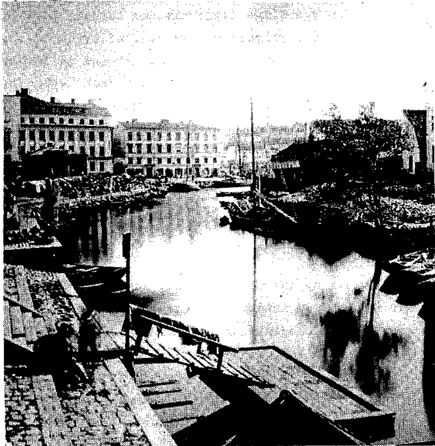
Utsikt över Riddarholmskanalen från brofästet vid Riddarhustorget. Foto från 1860-talet i Stockholms stads museum.