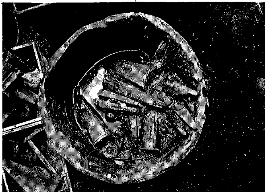
Ämunitionsbalja innehållande kulor och karteschär Baljan påträffades stående i förskeppet.