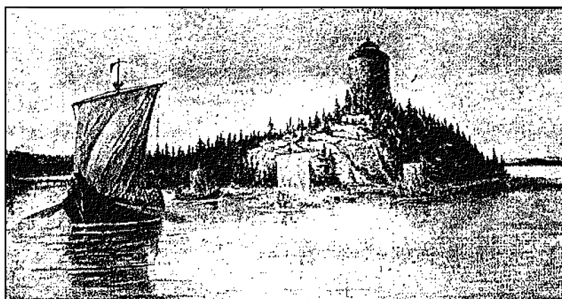
Karta från marinarkeologisk undersökning vid Saxholmen samt medeltidsborg ur Kristinehamns jubileumstidning.