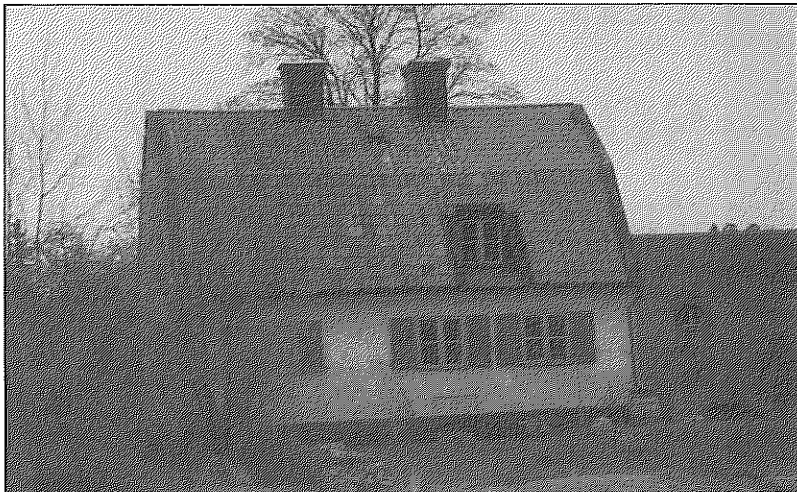
På Duvnäsudde (tidigare kallad Duvnäs holme) finns den fina krogbyggnaden från 1700-talet bevarad.

1800-talet. Då hade den närmaste krogen, Korsudden, som låg något längre norrut på andra sidan sundet, lagt ner och många ångbåtar på väg mellan Stockholm och Gustavsberg lade till vid Duvnäs holme för ett besök på krogen (Ahlberg 1964, s54). Krogbyggnaden, ett gult stenhus med brutet tak som uppfördes redan på 1700-talet när ett tegelbruk fanns på holmen, har renoverats omsorgsfullt och är idag en privat villa.