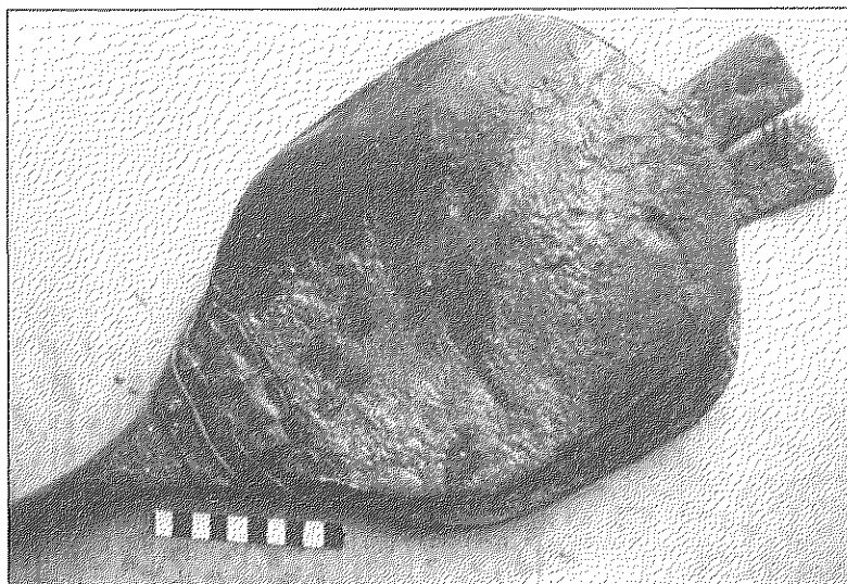
Ett av de föremål från Mary Rose som visas på Vasamuseet är denna blåsbälg i trä och skinn.