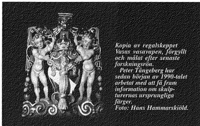
Kopia av regalskeppet Vasas vasavapen, förgyllt och målat efter senaste forskningsrön.

Peter Tångeberg har sedan början av 1990-talet arbetat med att få fram information om skulpturernas ursprungliga färger.