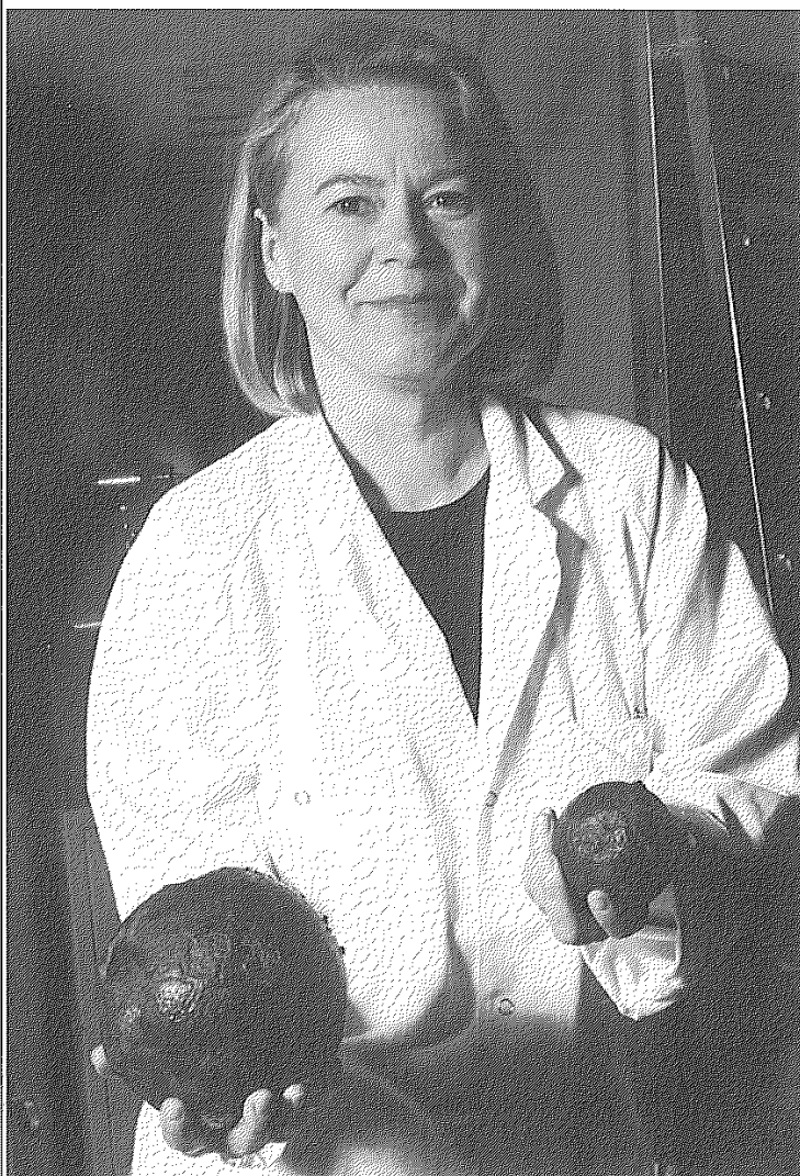
Marinarkeologisk Tidskrift 2 • 99

G jutjärn har framställts i Sverige sedan 1500-talet. Vid marin- arkeologiska undersökningar påträffas gjutjärn huvudsak- ligen i form av kanoner, kanonkolor och grytor. I denna artikel beskriver jag orsakerna till varför gjutjärn i många fall bevaras bättre i sjöar och hav än smidesjärn och varför det är så svårt att konservera just denna typ av järn.