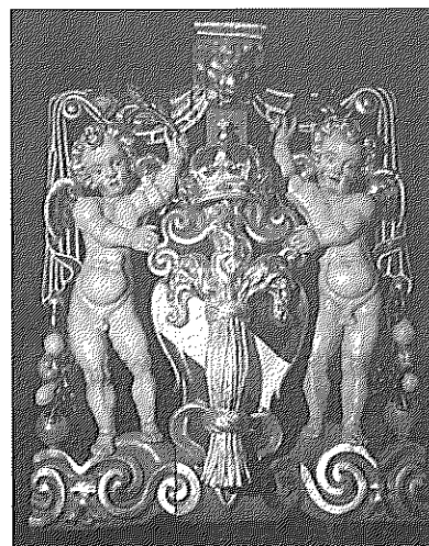
Kopia av regalskeppet Vasas vasavapen, förgyllt och målade efter senaste forskningsrön.

Utställningsproducent är Malin Fajersson. Formgivare är Ingald Andersson. Föreningen Vasamuseets vänner har lämnat stora bidrag till forskningen kring Vasas färgsättning.