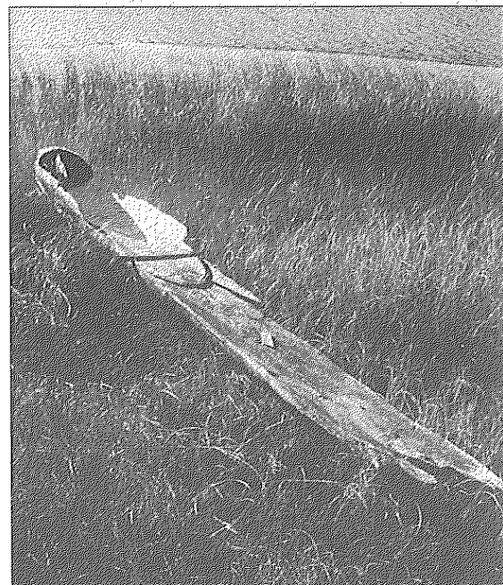
När vattennivån under senare år sänkts i Lillegölen har ett tiotal båtar och andra konstruktioner kommit fram i strandlinjen.