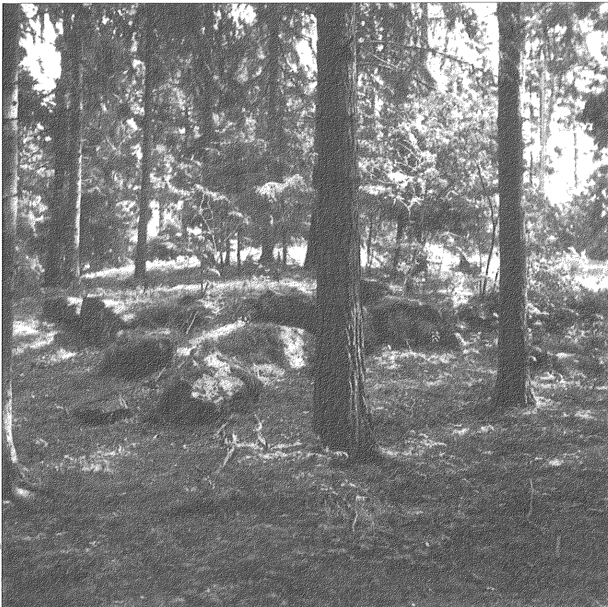
Figur 3. Fotot visar en av de ej undersökta husgrunderna på Broholmen som förmodligen utgör resterna av den gamla sjökrogen.