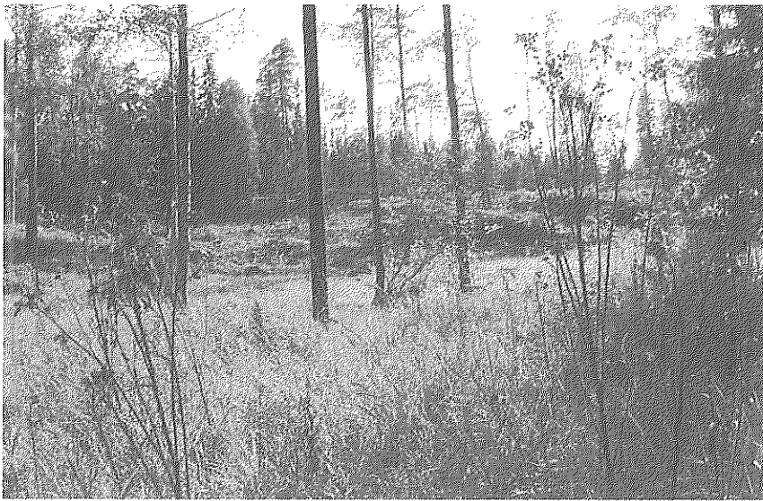
Bild 2. Gravfältet Raä 35 i Österhaninge socken består av 80 gravar – sju högar, 71 runda stensättningar, en kvadratisk stensättning och en treudd.

Under 1000-talet var Husbyån en vik och i diskussionen benämner jag dagens åmynning som inlopp till Husbyviken. Gravfältet, Raä 35, är relativt stort med 80 registrerade gravar (bild 2). Det kan naturligtvis vara så att inloppet inte alls fungerat just som hamn. Jag har här valt ut tre gårdar, Husby, Årsta samt Blista, att sätta i relation till inloppet och gravfältet. Dessa tre har bland annat enligt fornlämningsregistret gravar och andra fornlämningar som är daterade till yngre järnålder.