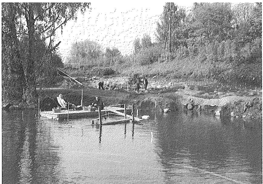
Bild 1 Undersökningsområdet vid Strandvägen 1 i Motala.

Boplatsen har bestått av ett "bostadsområde" med ett större hus, cirka 20 x 4 meter stort. Utanför detta finns ett område som benämns "köket" som innehåller stora mängder djurben – hjort, vildsvin men också fiskben. Ett område för yxbearbetning har också avgränsats – ämnen, avslag och slipstenar visar att trindyxor tillverkades och skärptes upp på platsen.