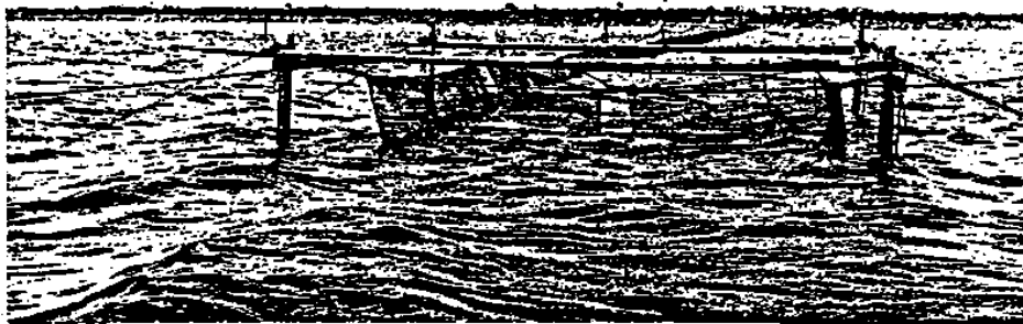
Bottengarn utanför Kristianopel på Blekinges ostkust (Blekingeboken 1955).

Bilden nedan visar ett bottengarn på fiskeplatsen. Näthuset är upphängt på en pålkonstruktion, vars hörnpålar förutom i botten även är förankrad i sidled. Näthuset, som upptill är öppet, hänger i pålkonstruktionens tvärbalkar och på cirka 1 m höjd över normalvattendjup. Detta för att nätets överkant inte skall komma under vattenytan vid högvatten och därigenom ge den instängda fisken möjlighet att simma över nätkanten.