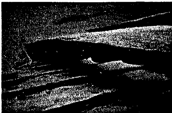
Fig 1. Detaljbild av bordläggning på klink.

Styrbordsida är förhållandevis intakt, åtminstone när det gäller fartygets bottenparti upp mot de första upplängorna. Fastän fartyget är överslammat och sönderbrutet, finns det en möjlighet att göra en tvärskepps - nollspantsrekonstruktion utifrån de delar som finns bevarade.