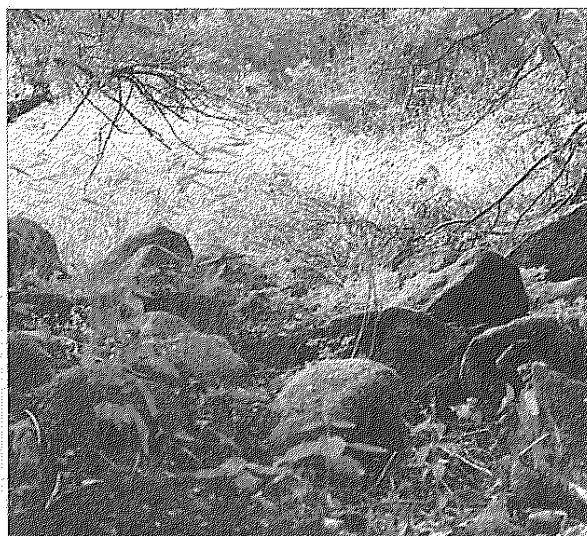
En gammal kajanläggning i strandkanten NO om Stäksundet

arkeologiskt fältseminarium 1993 sökte en grupp seminariedeltagare genom området och en rad intressanta anläggningar upptäcktes. På bägge sidor om sundet finns en stenvall. Stenarna är tämligen stora och inte sprängda. Ca 30 meter österut från denna vall på sundets norra sida finns rester av en husgrund eller möjligen en vägbank av naturlig sten. Nedanför denna finns en stenpir av stora, osprängda stenar. Under dessa syns rester av stockar sticka fram. Strax utanför syns också pålar i vattnet.